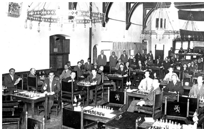
Εικόνα 1 Από τη σκακιστική Ολυμπιάδα του 1928 που διοργανώθηκε στη Χάγη της Ολλανδίας.

Η πρώτη Ολυμπιάδα που έλαβε χώρα ήταν ανεπίσημη και ήρθε σαν αποτέλεσμα μιας αποτυχημένης προσπάθειας να συμπεριληφθεί το σκάκι στους Ολυμπιακούς Αγώνες του 1924, που αντιμετώπισε πρόβλημα με το διαχωρισμό των παικτών σε επαγγελματίες και ερασιτέχνες. Πιο συγκεκριμένα, στην Ολυμπιάδα και σε εναρμόνιση με τις απαιτήσεις της ΔΟΕ είχε αποφασιστεί να μη συμμετάσχουν «επαγγελματίες» ώστε να διευκολυνθεί η αποδοχή του σκακιού στα ολυμπιακά αθλήματα. Κάθε χώρα απέκλειε μόνη της όσους παίκτες της θεωρούσε επαγγελματίες με συνέπεια κάποιες χώρες να μη συμμετάσχουν.