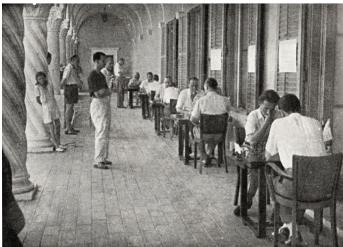
Εικόνα 4 Από τη συνάντηση του 5ου γύρου Γιουγκοσλαβία - Ελλάδα 4-0.

Η Ελλάδα θα περιοριστεί στη 16η, τελευταία θέση, με τουλάχιστον δύο αξιοσημνόμενυα ατομικά σκορ: Την καθοριστική νίκη του Μπουλαχάνη επί του Αργεντινού Ροζέτο και την ισοπαλία (σε κερδισμένη θέση) του Μαστιχιάδη με τον Αμερικανό πρωταθλητή Ρεσέβσκι.