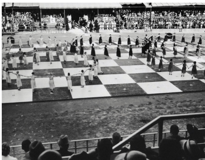
Εικόνα 2 Το 1936 η ναζιστική Γερμανία παράλληλα με τους Ολυμπιακούς αγώνες του Βερολίνου διοργάνωσε στο Μόναχο και την 3η ανεπίσημη σκακιστική Ολυμπιάδα. Η φωτογραφία είναι από την τελετή έναρξης των αγώνων.

Μετά το Λονδίνο, πραγματοποιήθηκαν οι επόμενες δύο επίσημες Ολυμπιάδες, στη Χάγη το 1928 και στο Αμβούργο το 1930. Ακολούθησαν διοργανώσεις κάθε δύο χρόνια που έφτασαν μέχρι την όγδοη που έλαβε χώρα στο Μπουένος Άιρες το 1939 και στην οποία συμμετείχαν 26 ομάδες. Η διοργάνωση του Μπουένος Άιρες, που κέρδισε η Γερμανία, ήταν η πρώτη που πραγματοποιήθηκε εκτός Ευρώπης και, δυστυχώς, η τελευταία που πραγματοποιήθηκε πριν από τον Δεύτερο Παγκόσμιο Πόλεμο. Οι αγώνες έγιναν κατά το χρονικό διάστημα 21 Αυγούστου - 19 Σεπτεμβρίου 1939, σε μια μοιραία περίοδο για την ιστορία της ανθρωπότητας αφού την 1η Σεπτεμβρίου 1939 τα Γερμανικά στρατεύματα εισέβαλαν στην Πολωνία.