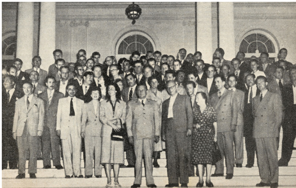
Εικόνα 5 Μετά τη λήξη της Ολυμπιάδας οι παίκτες πήγαν με ειδική πτήση στο Βελιγράδι για να συναντηθούν με τον Στρατάρχη Τίτο. Στο πανέμορφο Λευκό Παλάτι ο Τίτο έμεινε μαζί τους για πολλές ώρες. Ανάμεσα σε αυτά που τους είπε ήταν και ότι η παντελής έλλειψη χρόνου λόγω υποχρεώσεων δεν του επέτρεπε να αφοσιωθεί σε σκακιστική μελέτη.

1.64 ΙΖ6 2.γ4 ε6 3.Ιγ3 Αβ4 4.ΙΖ3 0-0 5.Ββ3 γ5 6.Αη5 Ιγ6 7.δχγ5 Αχγ5 8.ε3 Αε7 9.Αε2 β6 10.0-0 Αβ7 11.α3 θ6 12.Αθ4 Πγ8 13.Παδ1 Ια5 14.Βα2 Ιε4 15.Ιχε4 Αχε4 16.Αχε7 Βχε7 17.Ιδ2 Αα8 18.β4 Ιγ6 19.Ββ2 Πζδ8 20.Αζ3 δ6 21.Πγ1 Ιε5 22.Αχα8 Πχα8 23.Βδ4 Παγ8 24.Πζδ1 Βγ7 25.ζ4 Ιγ6 26.Ββ2 Ιε7 27.ε4 δ5 28.εχδ5 Βχζ4 29.δχε6 Βε3+ 30.Ρθ1 Βε2 31.εχζ7+ Ρζ8 32.Βγ2 Πδ4 33.Βθ7 Πγγ4 34.Πζ1 Πζ4 35.Ιζ3 Πχγ1 36.Πχγ1 Πχζ3 0-1.